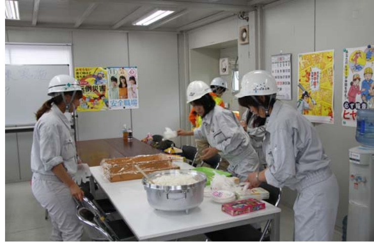
炊き出し訓練（おにぎり・煮麺）の実施状況